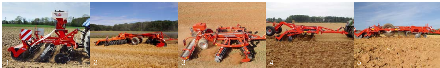
1. OPTIMER+ 2. DISCOVER 3. DISCOLANDER 4. CULTIMER L 5. PERFORMER

Pentru mai multe informații despre cel mai apropiat dealer KUHN, vizitați site-ul nostru www.kuhn.com